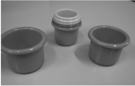
Նկար 2. Տարբեր չափերի գունավոր բաժակներ

Շատ կարևոր է կատարվող գործողությունների պատճառահետևանքային կապերի ընկալումը, եթե կատարում ենք որևէ գործողություն, ապա դա անում ենք՝ սպասելով կատարվելիք ինչ-որ այլ գործողության: Այստեղ տեղին է հիշել և նշել հետևյալ խոսքերը. «Երեխաները սովորում են շատ տարբեր եղանակներով, քան կարող ենք պատկերացնել»: